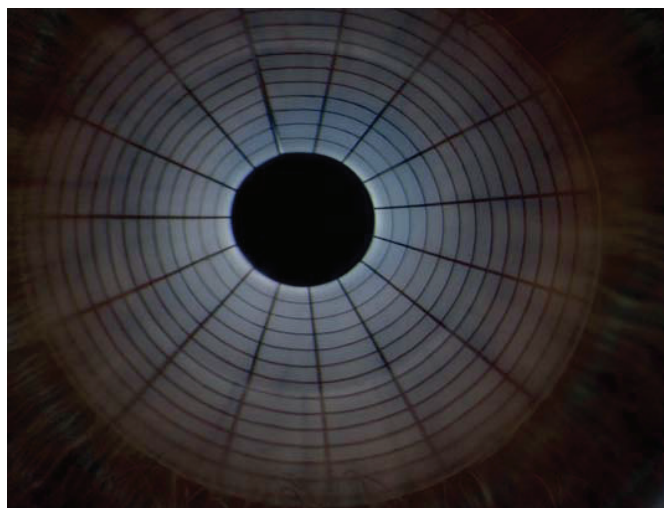
Griglia per la misura del NIBUT